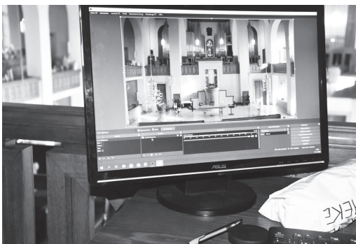
Blick auf den Regiemonitor der neuen Streaming-Anlage.

Alle Gottesdienste werden seit dem 15. November live auf Youtube übertragen. Auf der Frontseite von www.evangel-arbon.ch findet sich ein prominent plazierter Link zum Youtube-Kanal.