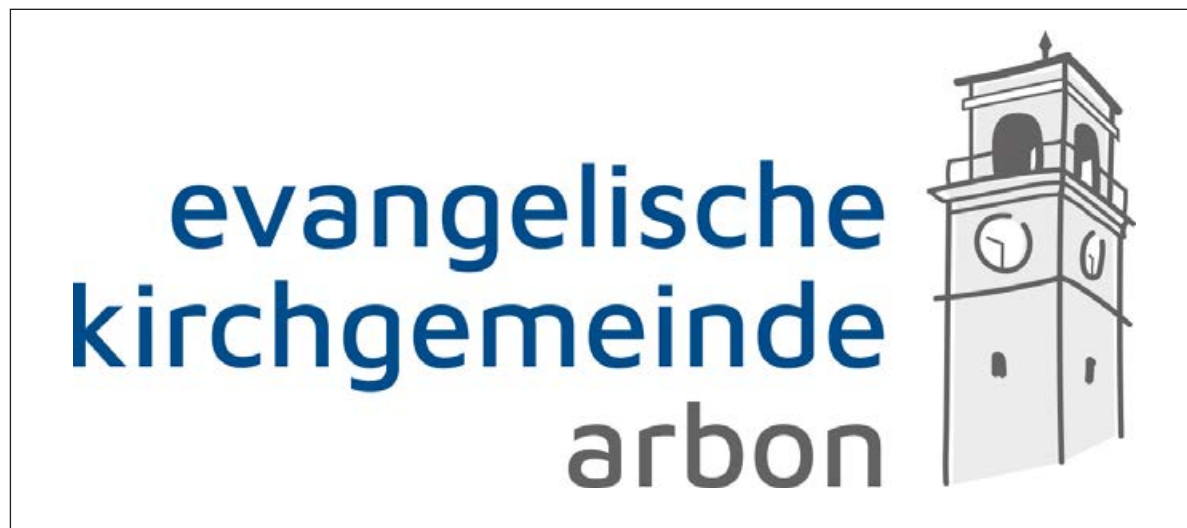
Das neue Logo der Kirchgemeinde Arbon