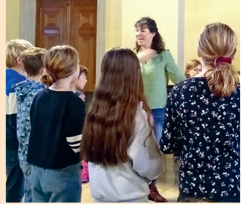
Einblick in die Probenarbeit

Bei Punsch, Glühmost und Kuchen können dann nach der Feier noch alle grossen und kleinen Gottesdienstbesucher*innen auf dem Kirchplatz beisammen sein. Um die