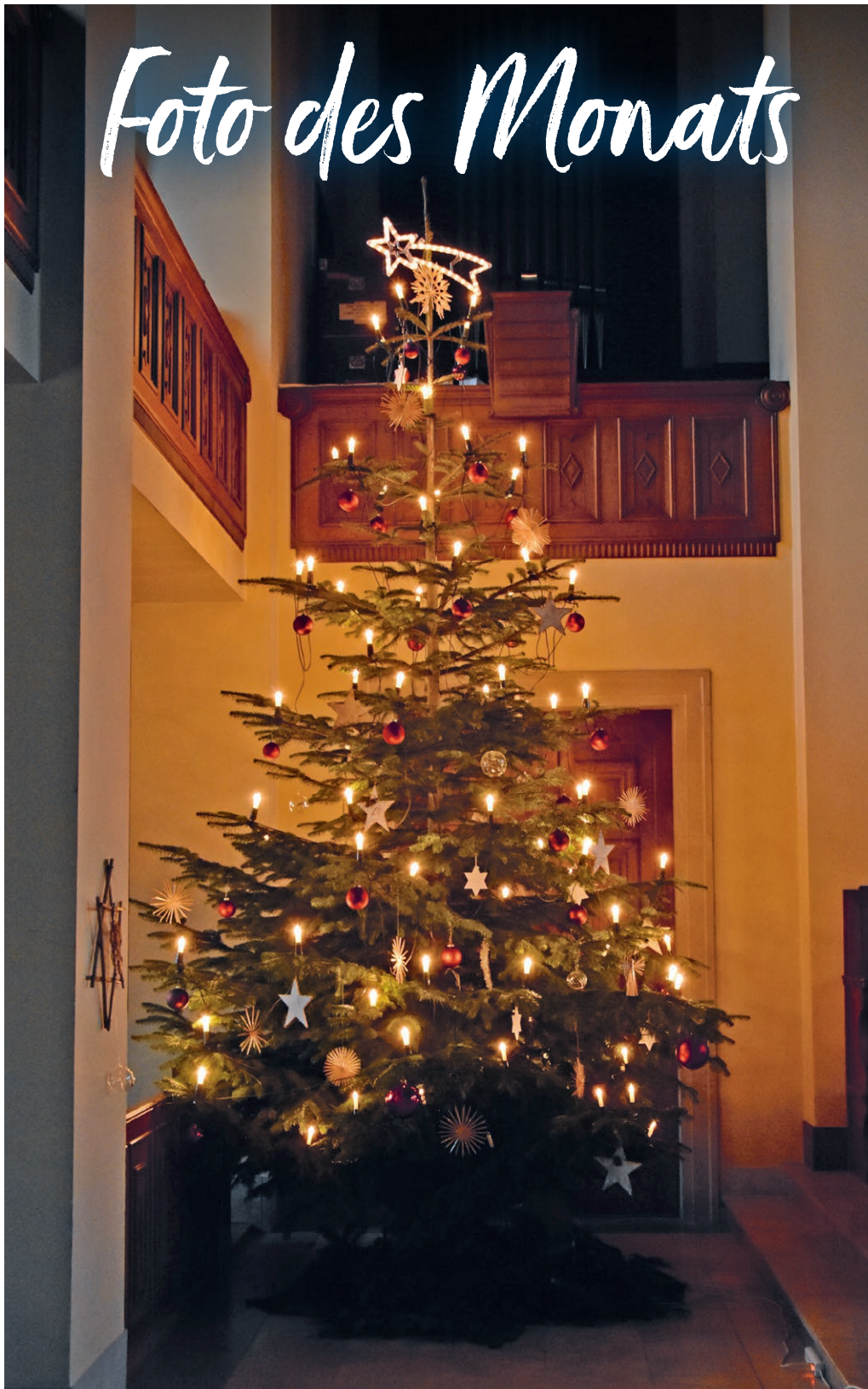
Foto des Monats