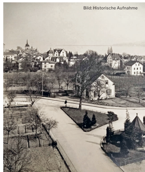
Bild: Historische Aufnahme