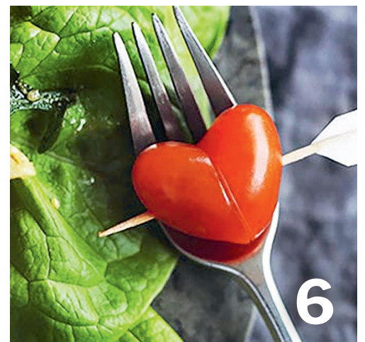
Herzhunger – Essen, was das Herz begehrt