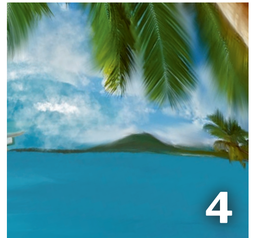
Kia orana – Weltgebetstag